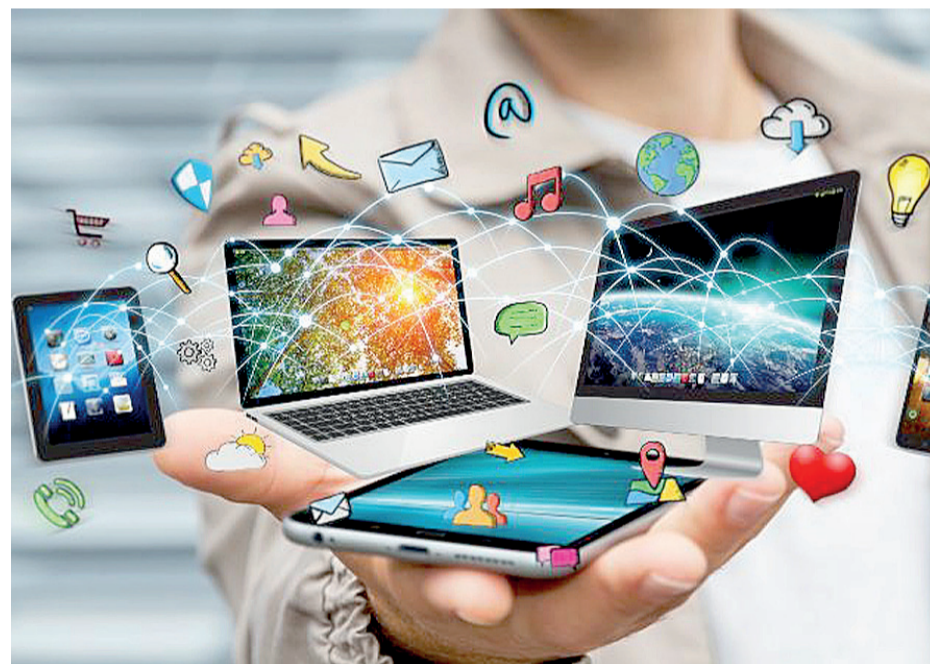
Los servicios en la nube han ayudado definitivamente a democratizar el acceso a la tecnología por parte de las pymes. F.E

Dado que no todos los clientes tienen la misma necesidad, instituciones donde por temas de regulación no pueden tener la data en una nube pública sino de manera local, existe lo que se llama "Cloud at Customer", un servicio que permite disponer de una nube pública pero localizada en la oficina del cliente, lo que brinda una facilidad para ciertas industrias como banca s y gobierno", concluye Marrero. elCaribe